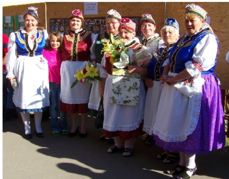
Kerecsendi falunapok 2008. szeptember 13-14.